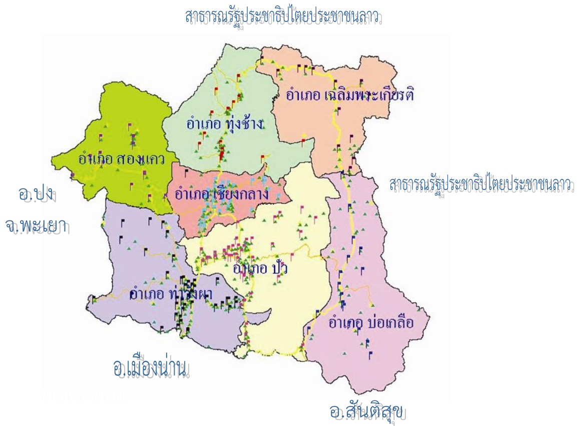
รูปที่ ๑ แผนภาพแสดงพื้นที่ในการกำกับดูแลการจัดการศึกษาขั้นพื้นฐาน และอาณาเขตติดต่อของสำนักงานเขตพื้นที่การศึกษาประถมศึกษาน่าน เขต ๒